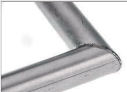
Svarový šev pro rohový spoj trubek

Oblouková mikrosvářečka otevírá nové možnosti spojování materiálů náročných tvarů a geometrií. Následující příklady použití ukazují jen výběr z mnoha možností, které se vám s obloukovou mikrosvářečkou otevírají. Do mnohotvárného světa přesného svařování tak můžete vepsat vlastní kapitolu o svařování s Micro Arc Welder.