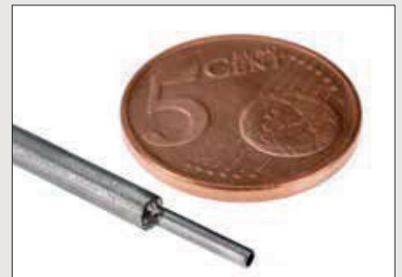
Pevné svařování tlakových potrubí