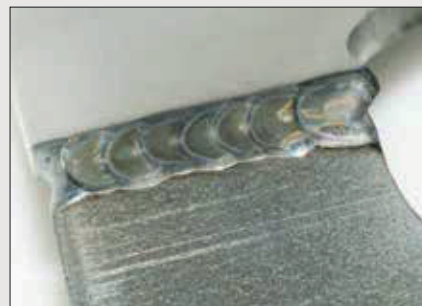
Svarové spoje různých materiálů