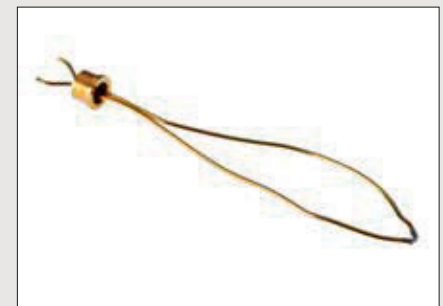
Výroba snímačů teploty (na obrázku je pozlacený platinový snímač)