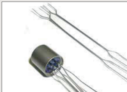
Jemné svařování elektronických součástek, např. termočlánků