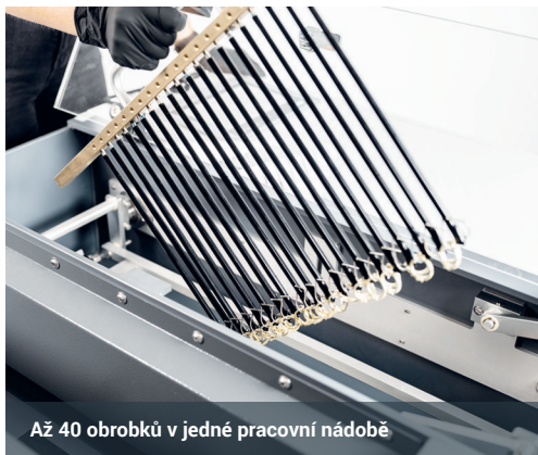
Až 40 obrobků v jedné pracovní nádobě