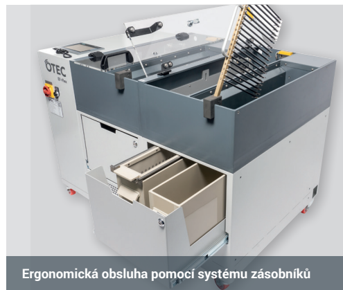
Ergonomická obsluha pomocí systému zásobníků

Zpracování jemných a členitých šperků se složitou geometrií vyžaduje obzvláště šetrný způsob vyhlazování a leštění. EF-Flex dává jiskřivému lesku zcela nový význam a to i u šperků již osazených kameny. Ruční práce je minimalizována. Dokonalá spolehlivost procesu, perfektní zpracování i v těch nejmenších záhybech a extrémně krátké procesní časy zajišťují hospodárnost a velkoobjemové zpracování.