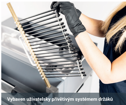
Vybaven uživatelsky přívětivým systémem držáků