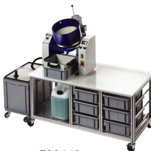
ECO | 18

Řada ECO Maxi a ECO | 18 představuje zařízení od firmy OTEC pro hromadné opracování. Široká škála dostupných velikostí Vám umožňuje vybrat to správné zařízení pro každou aplikaci. Od malých po velké – od jednotlivých obrobků po velké výrobní série.