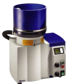
Úsporné řešení pro malovýrobu: Zařízení ECO-Maxi je dokonalé, propracované a rozšiřitelné.