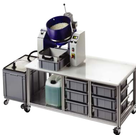
Omílací zařízení pro větší výrobní série: Zařízení ECO | 18 – cenově dostupná inovativní technologie.