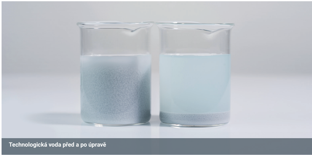
Technologická voda před a po úpravě