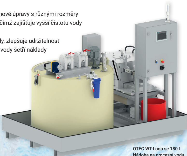
OTEC WT-Loop se 180 l Nádoba na procesní vodu