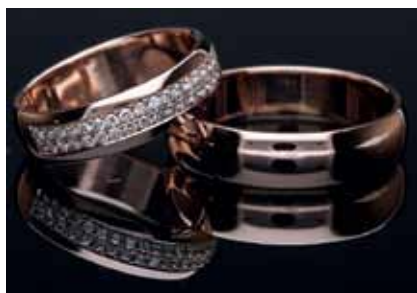
Brilantové svatební prsteny

celú technológiu zlatníckej ručnej práce v kombinácii s technológiou odlievania. Od úplného návrhu, modelovania voskových modelov, pečenie gumených foriem po odlievanie, následné fasovanie kamienkov až po povrchové opracovanie, leštenie a galvaniku. Stal som sa jedným z kľúčových zamestnancov, ale môj sen bolo niečo iné a z práce som odišiel. Po krátkom čase som dostal pracovnú ponuku do Prievidze, kde som v podstate po nástupe dostal za úlohu rozbehnúť komplet nanovo