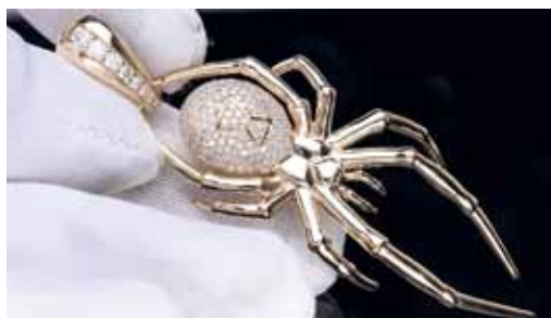
18kt žlté zlato 171 brilantů