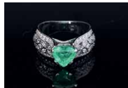
Smaragdový prsten s 63 ks brilanty